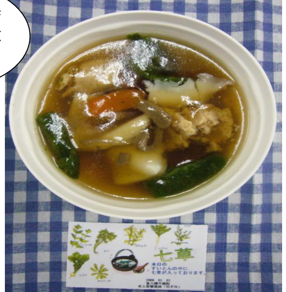
行事食-七草すいとん