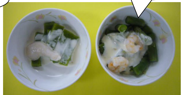
アスパラのお浸し